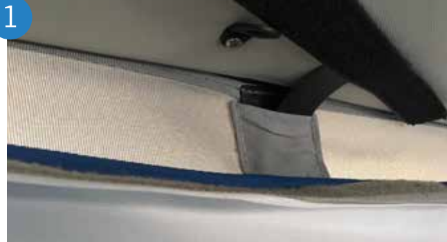
1. Colocar las "T" de velcro en las 4 ranuras.