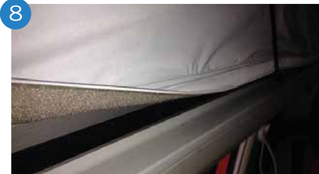
8. Pegar velcros adhesivos.