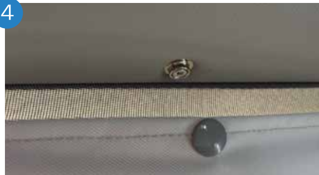
4. Atornillar los remaches laterales al techo.