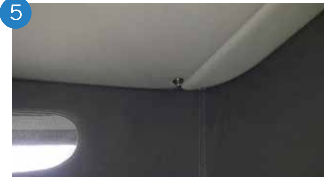
5. Atornillar los dos remaches al techo (techo eléctrico).