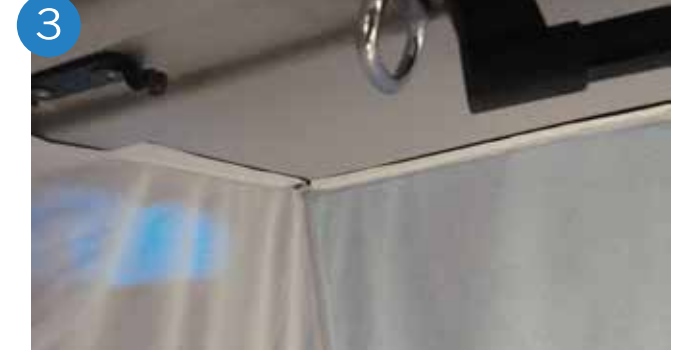
3. Pegar velcro sobre el plástico del techo (techo manual).