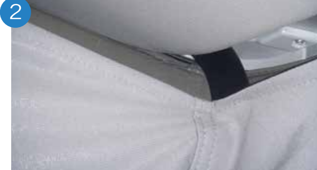
2. Introducir la solapa entre la tapicería del techo (detrás).