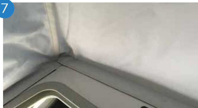
7. Pegar velcros adhesivos.