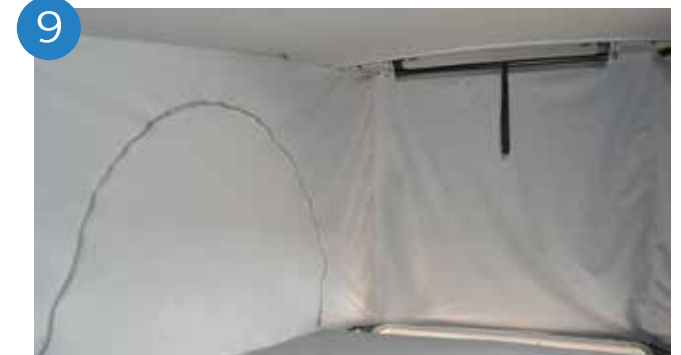
9. Ya tenemos el aislante instalado.