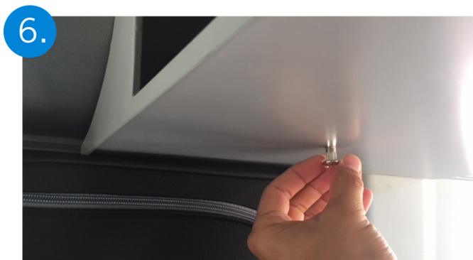
6. Encajar la hembra y apretar hasta dejarlo fijo.