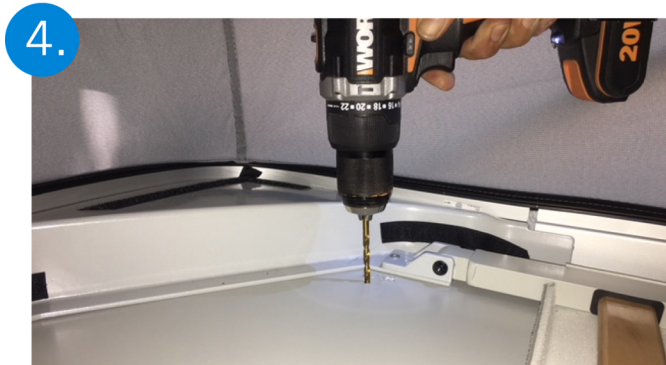
4. Perforar con broca de 5mm para aluminio, repetir con la broca de 8mm para facilitar el montaje.