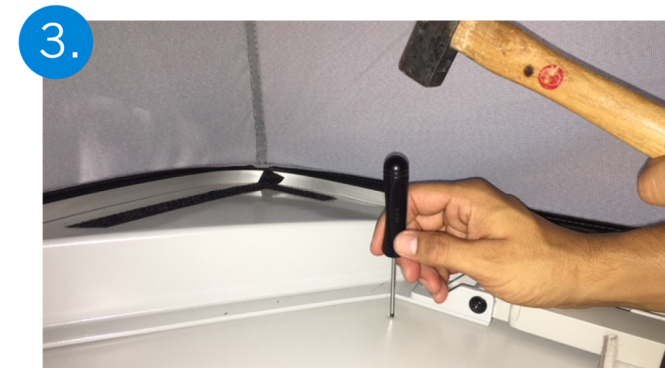
3. Marcar los agujeros con ayuda de un punzón.