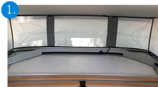
1. Quitar el colchoncillo trasero y colocar plantilla.