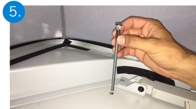
5. Pasar las varillas